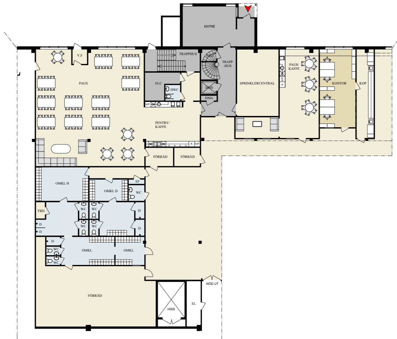
(FÖRSTORAD DEL AV) PLAN BV 1:250